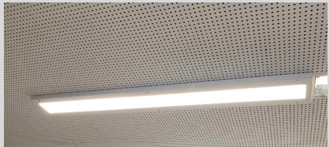
passend dazu Aufbaurahmen 1300x150mm