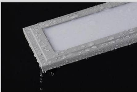
Panel Format 1297x147mm